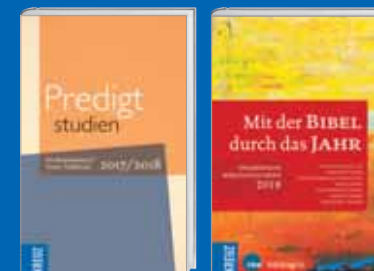
Predigt / Bibel S. 18 - 19