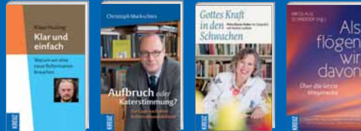
Aktuelle Sachbücher S. 4 - 11