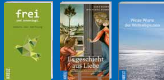
Meditation / Gebet S. 12 - 17